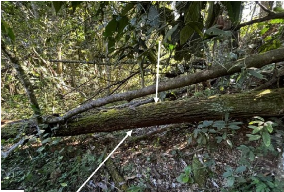
Fig.2 - Foto da Maçaranduba encontra-se caída, com as raízes já fora do solo e sem nenhuma brotação.