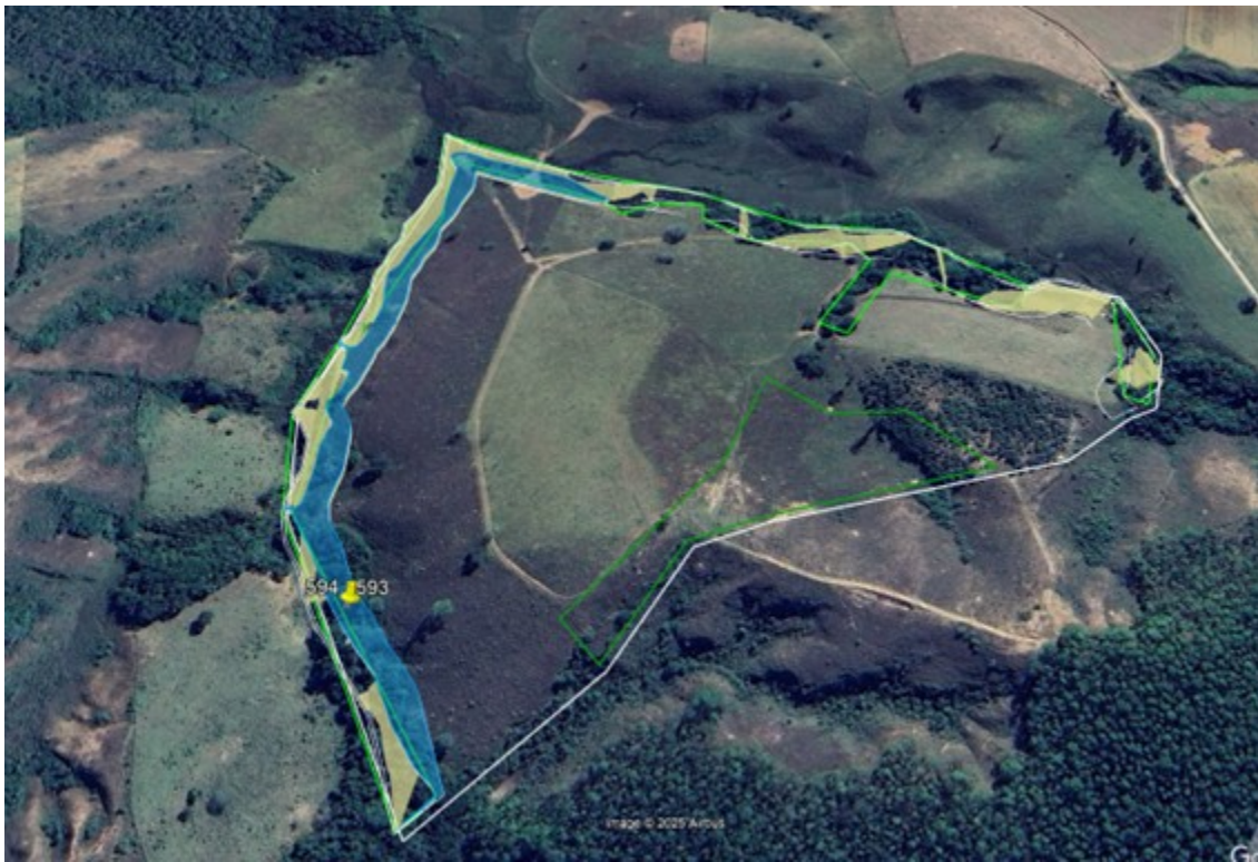
Fig.1 - Imagem detalhando o local.