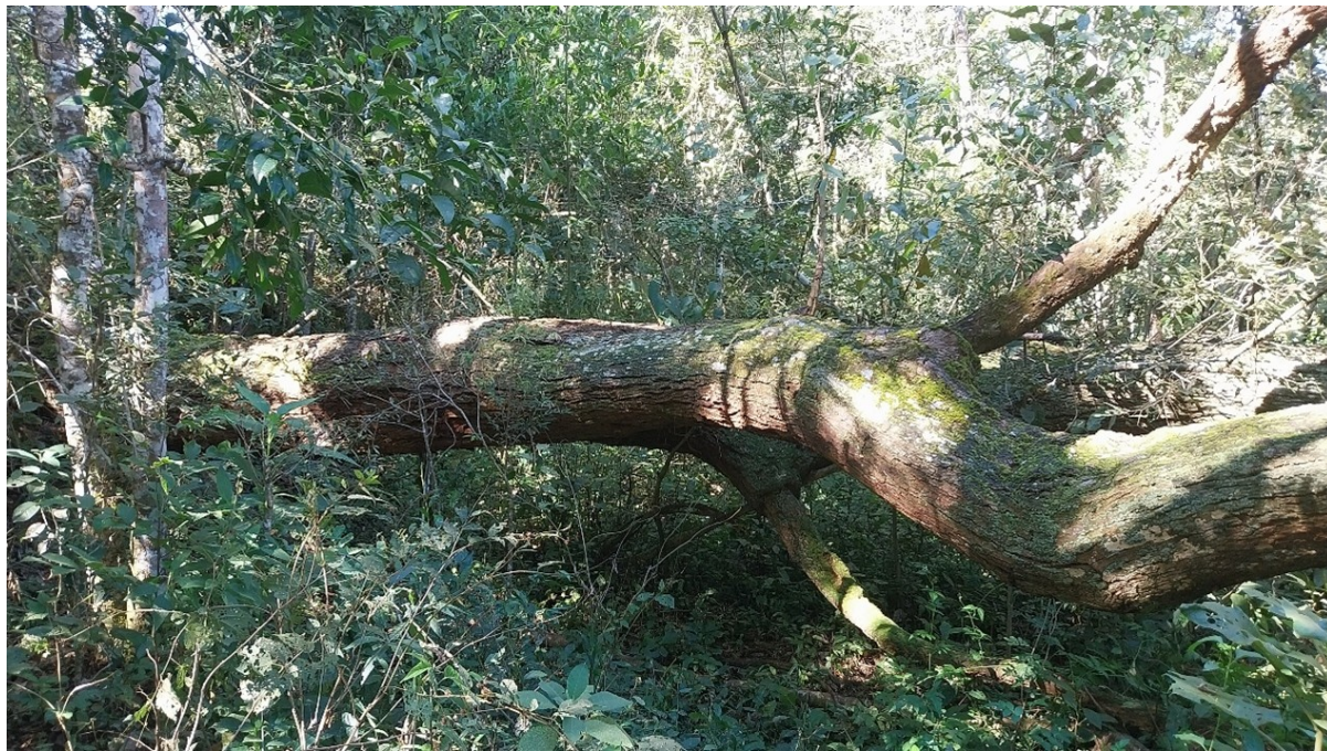
Fig.3 - Imagem do indivíduo de Jacarandá.

A área onde se encontram as árvores é ocupada por um trecho de fragmento florestal típico de Floresta Estacional Semidecidual, em Área de Preservação Permanente.