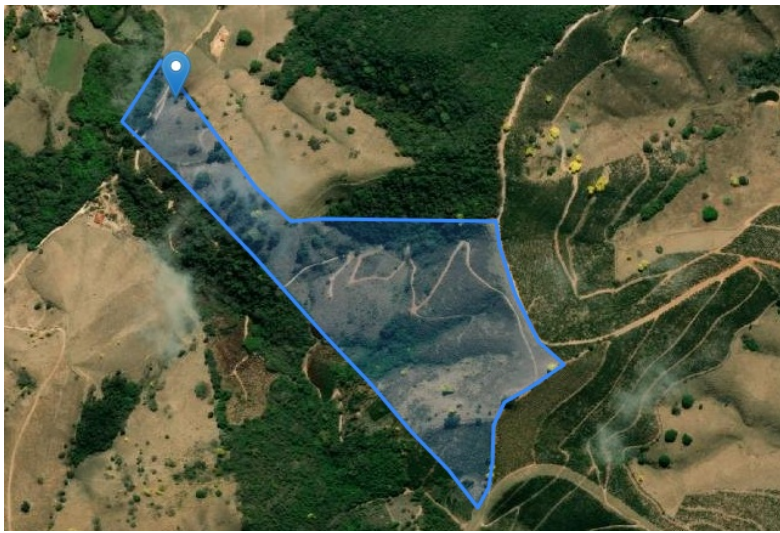
FIGURA 02: Imagem de satélite com local do corte.