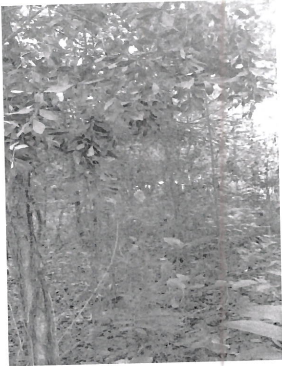
IMAGEM - LOCAL