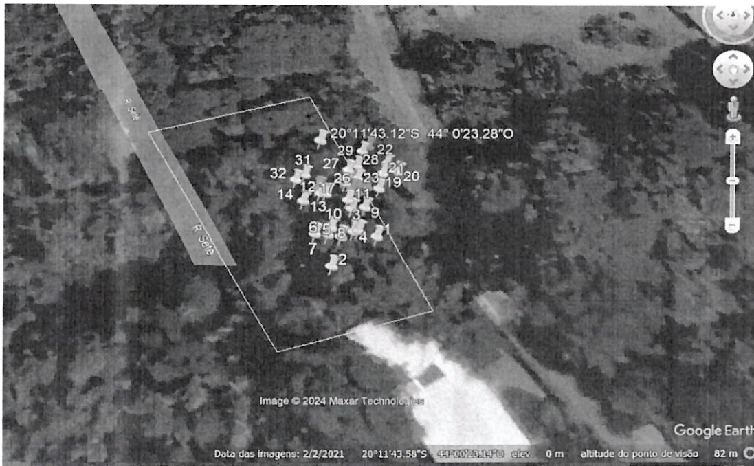
Imagem 01: Vista aérea do local demonstrando a área de intervenção ambiental