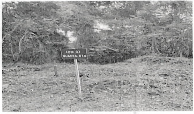
Fotos 01, 02, 03 e 04: Demostra área de intervenção ambiental (vista fronta e interna) de 311,23m 2 ; Fonte: (Fotos feitas pelo técnico).