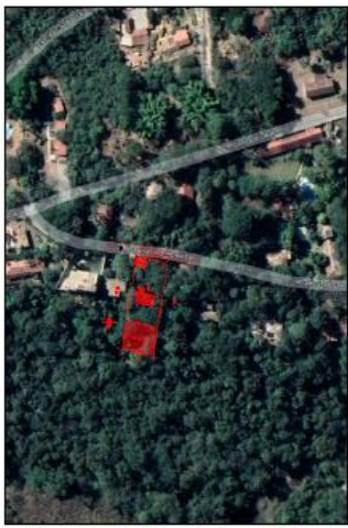
TABELA DE ÁREAS