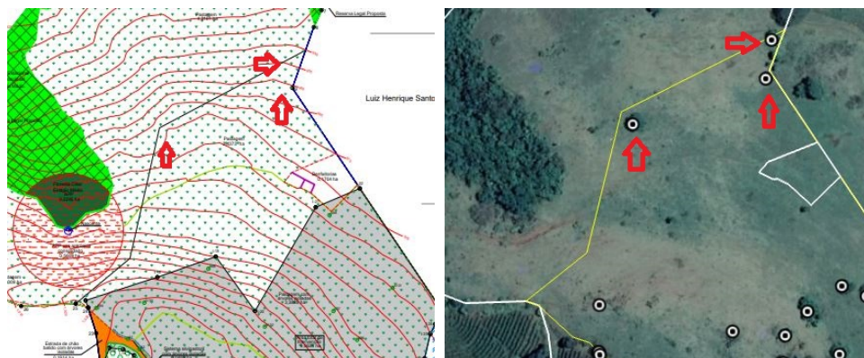
Figura 2: Print parcial da planta topográfica (à esquerda) com detalhe nas três setas vermelhas que demonstram que não há indivíduos requeridos nos locais, e print da imagem do Google Earth (à direita) com detalhe nas três setas vermelhas que demonstram três indivíduos requeridos nos mesmos locais.

- Em campo foi observado que existem árvores não requeridas no processo, as quais estão demarcadas, dentro da área de intervenção, com números além do número total de árvores requeridas (ex: foi observado árvores demarcadas com números "107", "110", "114", "116" dentro da área de intervenção);