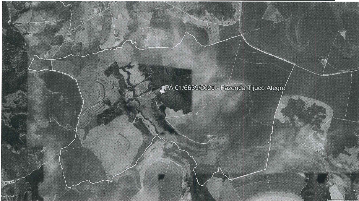
Figura 2 - Área de Fazenda Tijuco Alegre (delimitação em amarelo), destacando-se as áreas de supressão (delimitação em verde), e as destocas em vermelho.