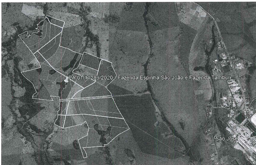
Figura 2 - Área da Fazenda Espinha São João e Fazenda Tamburi (delimitação em amarelo), destacando-se as áreas de supressão (delimitação em verde), bem como as áreas de Preservação Permanente – APPs (delimitação em vermelho) e reserva legal (azul escuro).