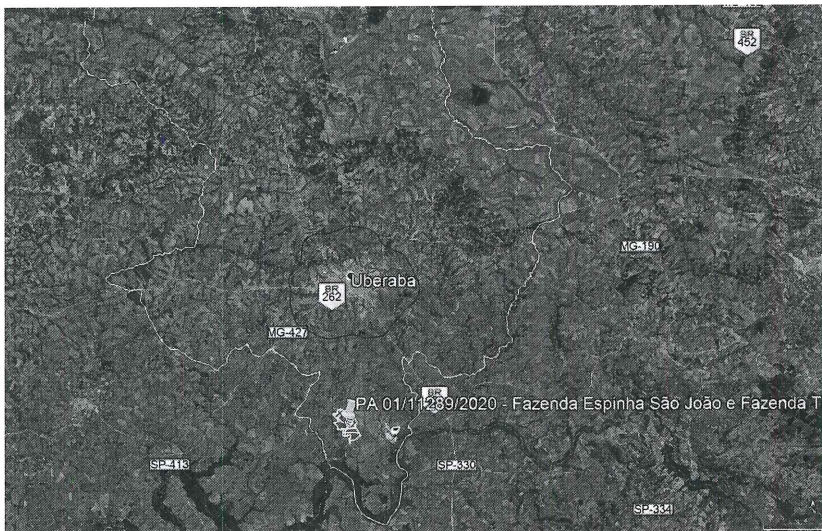
Figura 1 - Localização do empreendimento em Uberaba, marcador e delimitação em amarelo. Em branco, limite do município. Em azul escuro, limite do perímetro urbano. Em vermelho, limite da APA.