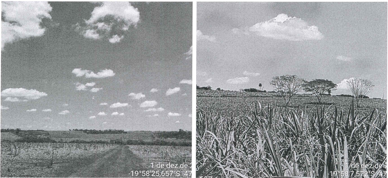
Figura 3 – Vista parcial da Fazenda Espinha São João e Fazenda Tamburi.