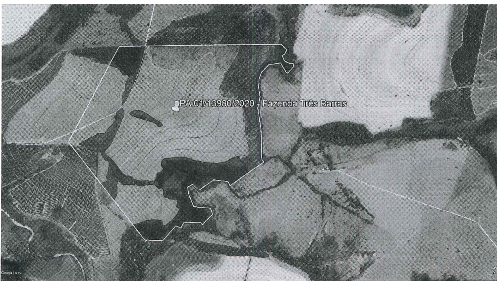
Figura 2 - Área da Fazenda Três Barras (delimitação em amarelo), destacando-se a área de supressão (delimitação em verde), bem como as áreas de Preservação Permanente – APPs (delimitação em vermelho) e reserva legal (azul escuro).