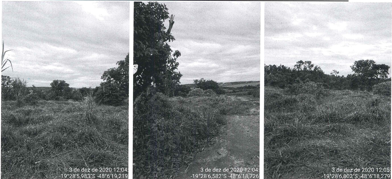
Figura 5 – Vista parcial da Fazenda Três Barras.