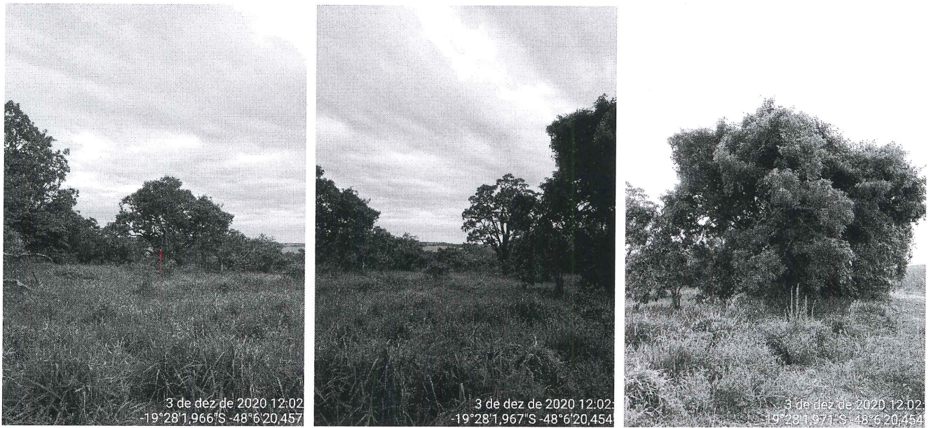
Figura 3 – Vista parcial da Fazenda Três Barras.