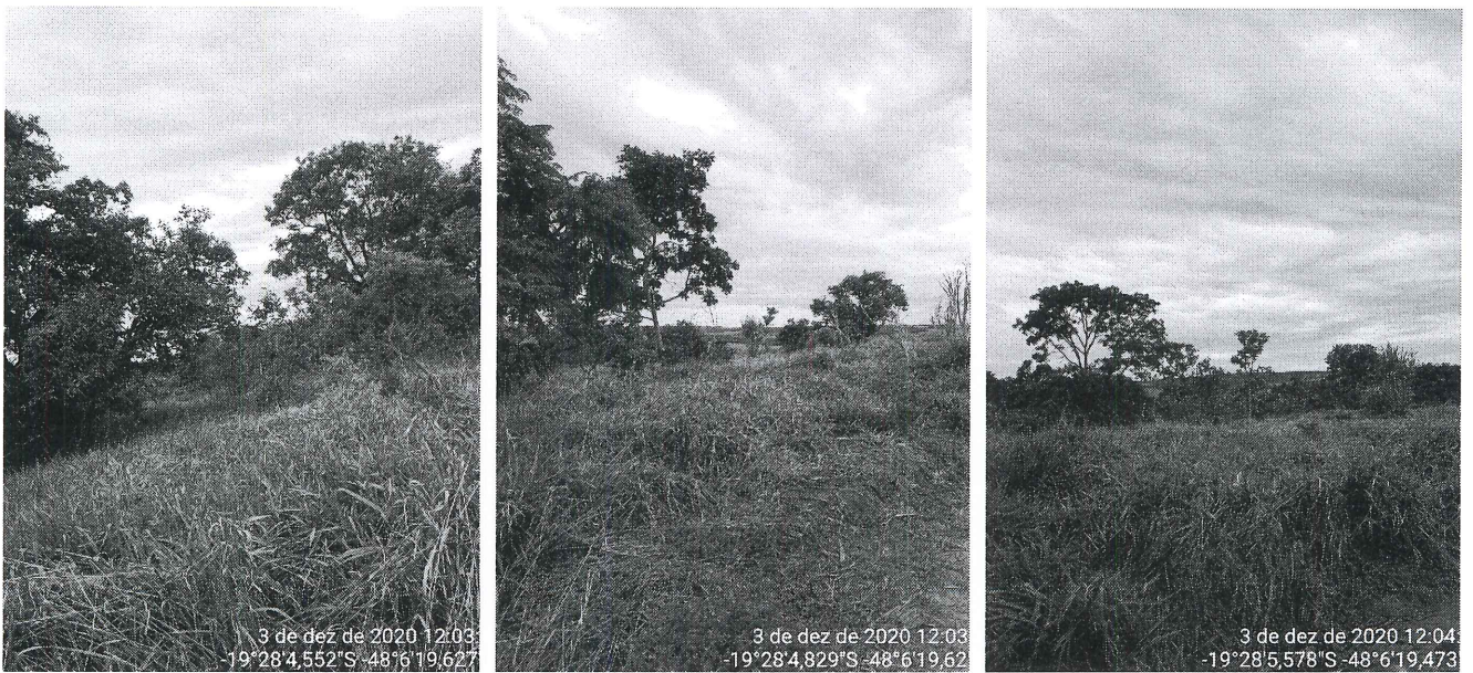
Figura 4 – Vista parcial da Fazenda Três Barras.