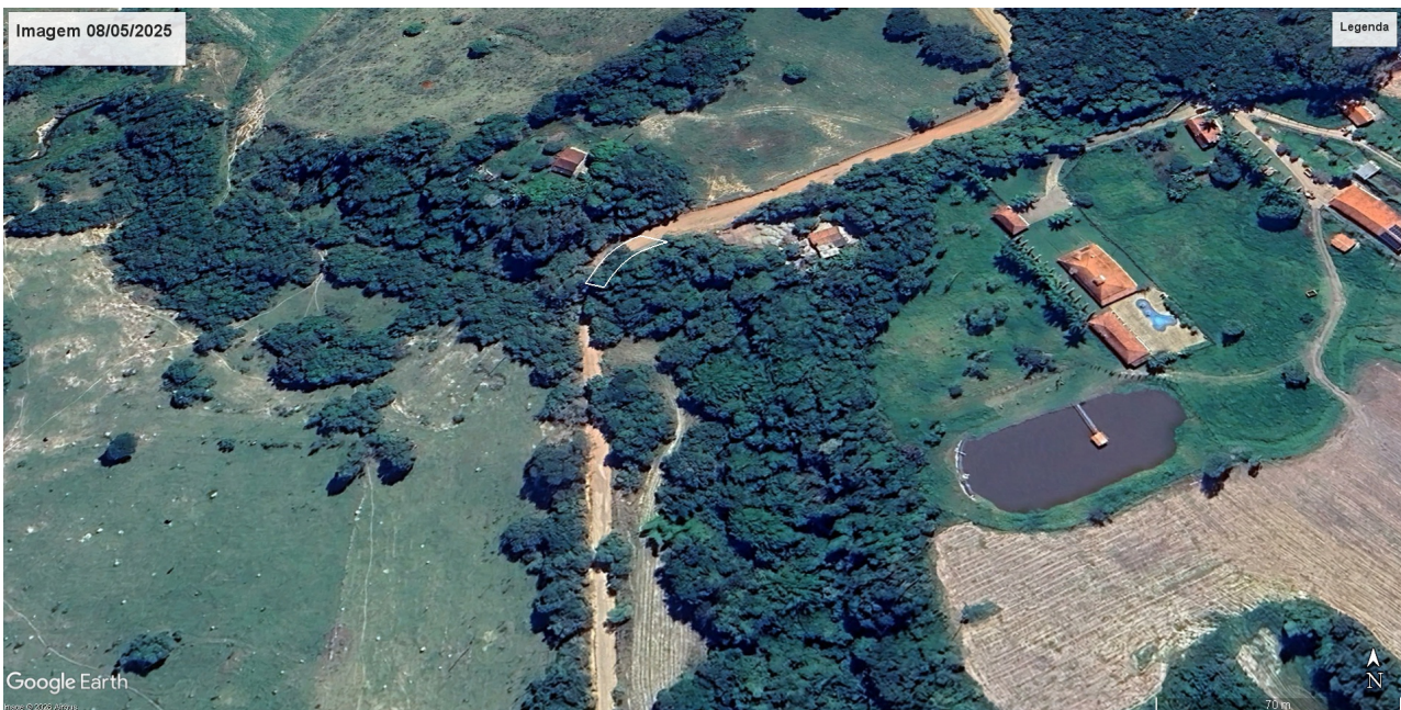
Imagem 02 - fonte: Google Earth