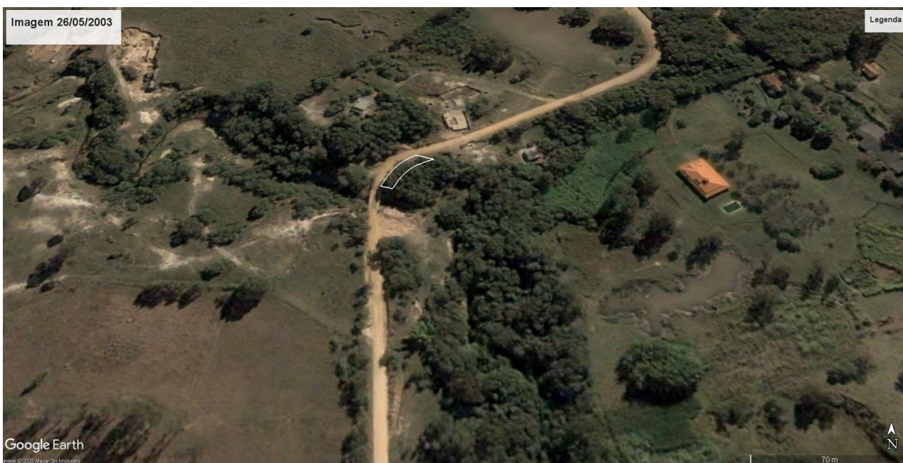
Imagem 01

Conforme art. 24 da Resolução Conjunta SEMAD/IEF Nº 3.102, de 26 de outubro de 2021, realizada vistoria remota em 02/03/2026, através de utilização de imagens de satélite e outras geotecnologias disponíveis e foi assim constatado que se trata de uma área antropizada com a existência de estrada rural municipal conforme imagens de 26/05/2003 e 08/05/2025 conforme imagens históricas do Google Earth nas referidas datas e constatado ainda através do Mapbiomas se tratar de área antropizada conforme figura abaixo.