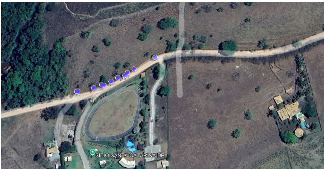
Imagem 1: Localização das árvores requeridas para corte.

O objetivo da intervenção ambiental é diminuir a sinuosidade em um determinado trecho da estrada conforme imagem abaixo: