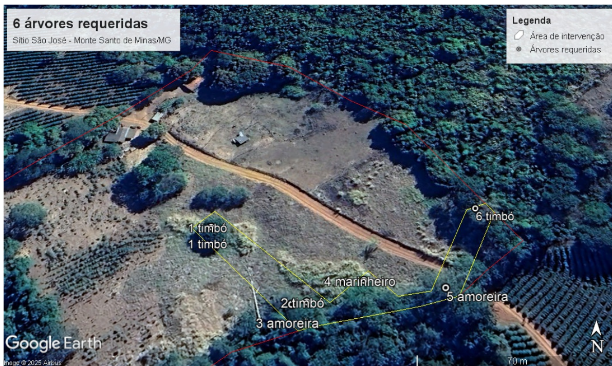
Figura 2 - Imagem de 2024 mostrando a área de intervenção ambiental do presente requerimento (delimitada em amarelo) e o perímetro (delimitado em vermelho) e a localização das 6 (seis) árvores que foram requeridas para corte.

Conforme figura 2, as árvores estão localizadas no limite do imóvel (polígono vermelho). O Projeto de Intervenção Ambiental Simplificado (PIA - 121642790 ) apresenta relatório fotográfico de alguns indivíduos a fim de comprovar que trata-se de árvores isoladas. E, visando verificar a ausência de conexão de copas, visto que as imagens de satélite mais recentes não deixam isso muito evidente, foi realizado vistoria técnica, dia 12/02/2026, pelo técnico José Carlos de Souza, conforme fotos e imagens abaixo.