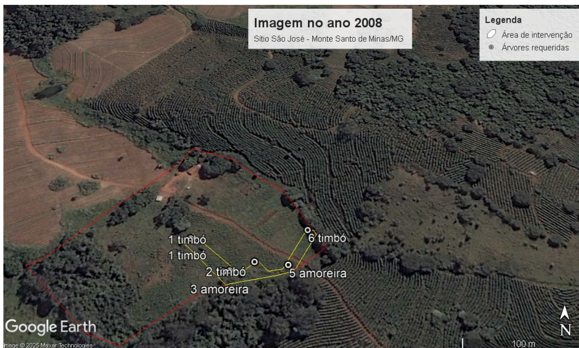
Figura 1 - Imagem de 2008 mostrando a área de intervenção ambiental do presente requerimento (delimitada em amarelo) e o perímetro (delimitado em vermelho).

Abaixo segue a Figura 1 e 2 com a localização geográfica das 06 (seis) árvores que foram requeridas para o corte, na propriedade rural Sítio São José conforme arquivos digitais fornecidos pela responsável técnica do referido projeto. A figura 1 refere-se a imagem de satélite de 2008, comprovando o uso consolidado da área, na época com cafeicultura. E, a figura 2 refere-se a imagem de 2024.