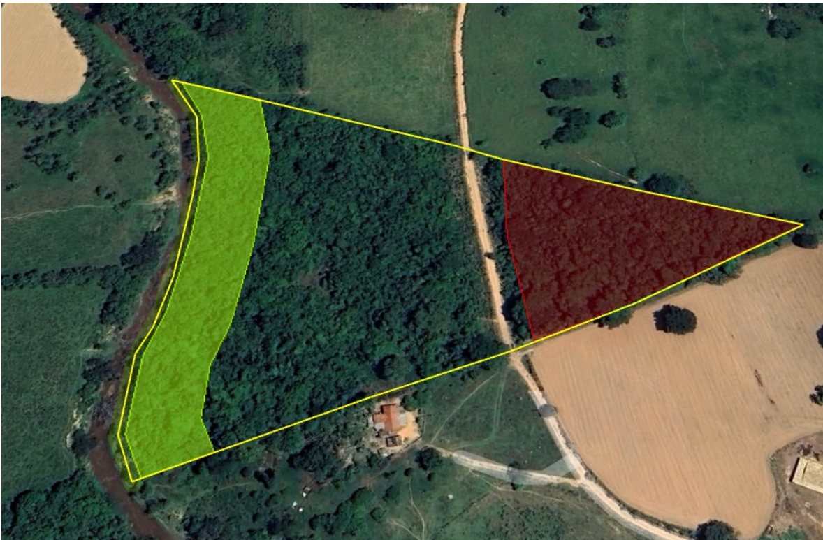
Imagem 1: Perímetro da Fazenda Paciência. Ano 2023.

IV – árvores isoladas nativas: aquelas situadas em área antropizada, que apresentam mais de 2 m (dois metros) de altura e diâmetro do caule à altura do peito – DAP maior do que 10 cm, cujas copas ou partes aéreas não estejam em contato entre si ou, quando agrupadas, suas copas superpostas ou contíguas não ultrapassem 0,2 hectare;