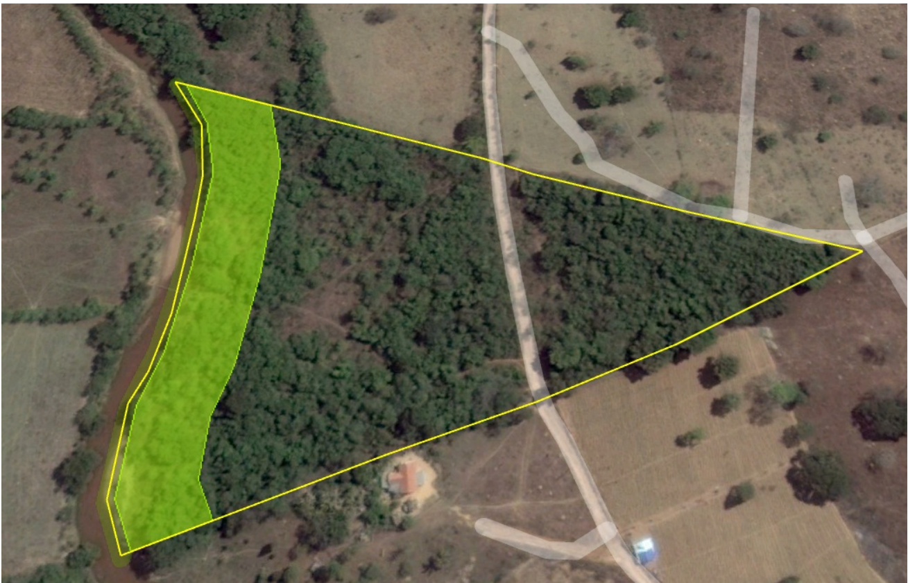
Imagem 2: Perímetro da Fazenda Paciência. Ano 2010.

Entretanto há de se considerar que no Cadastro Ambiental Rural-CAR da propriedade, não foi indicada a existência de área consolidada na referida propriedade, conforme imagem