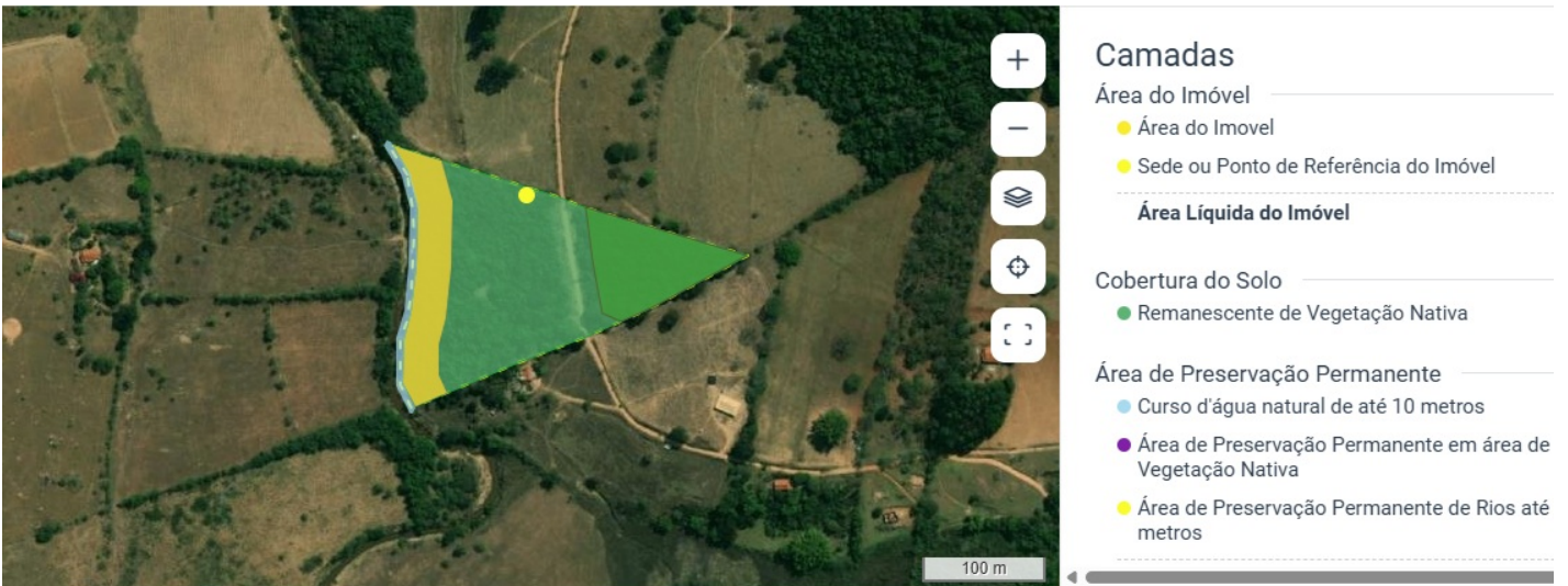
Imagem 3: Cadastro Ambiental Rural-CAR da Fazenda Paciência.

Entretanto há de se considerar que no Cadastro Ambiental Rural-CAR da propriedade, não foi indicada a existência de área consolidada na referida propriedade, conforme imagem