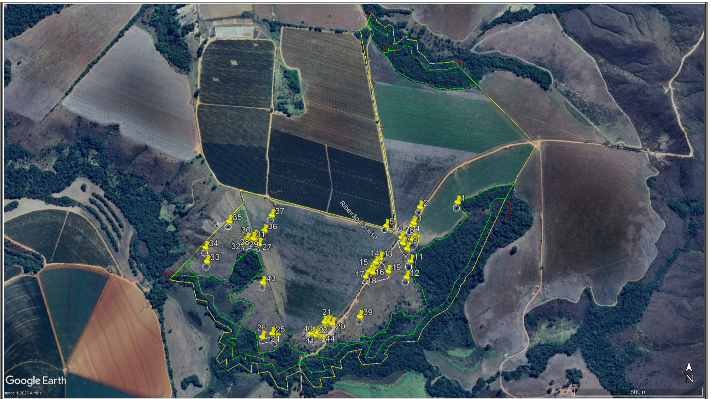
Figura 2. Imagem de satélite do mês de fevereiro de 2019, disponibilizada no Google Earth Pro, com a área que possui fitofisionomia de campo limpo/cerrado e a localização das árvores requeridas.