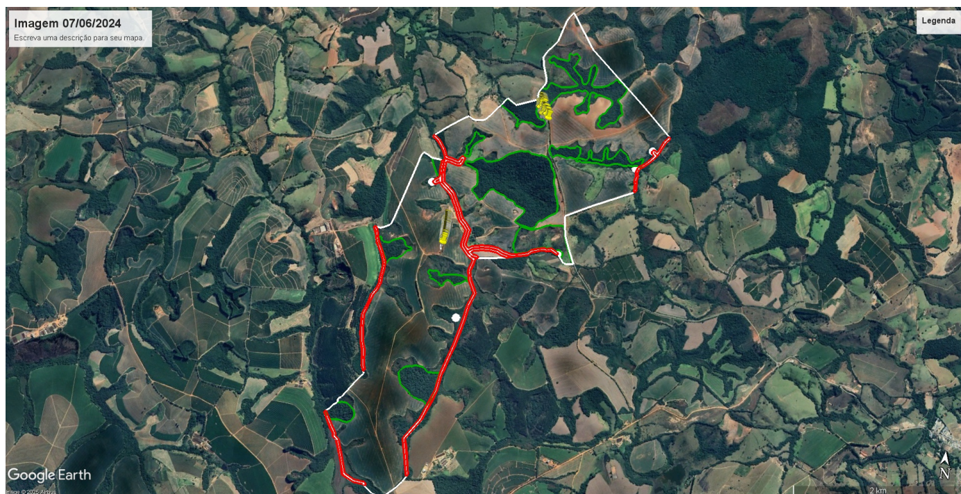
Imagem 02