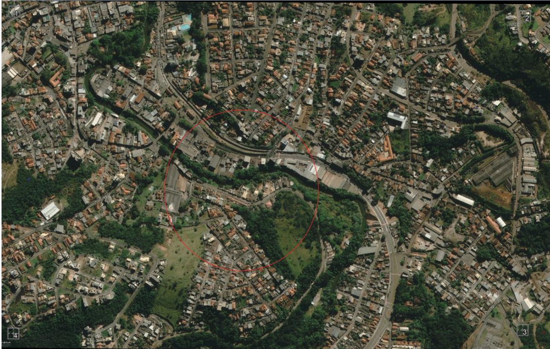
Cidade de Itabirito/MG, ano de 2020 (Google Earth).

Conforme evidenciado nas imagens do Comparativo Temporal da Área do Lote , observa-se que a região apresenta características de antropização desde, pelo menos, o ano de 2002. Ao longo desse período, a área passou por transformações significativas que reforçam sua classificação como uma zona antropizada e consolidada.