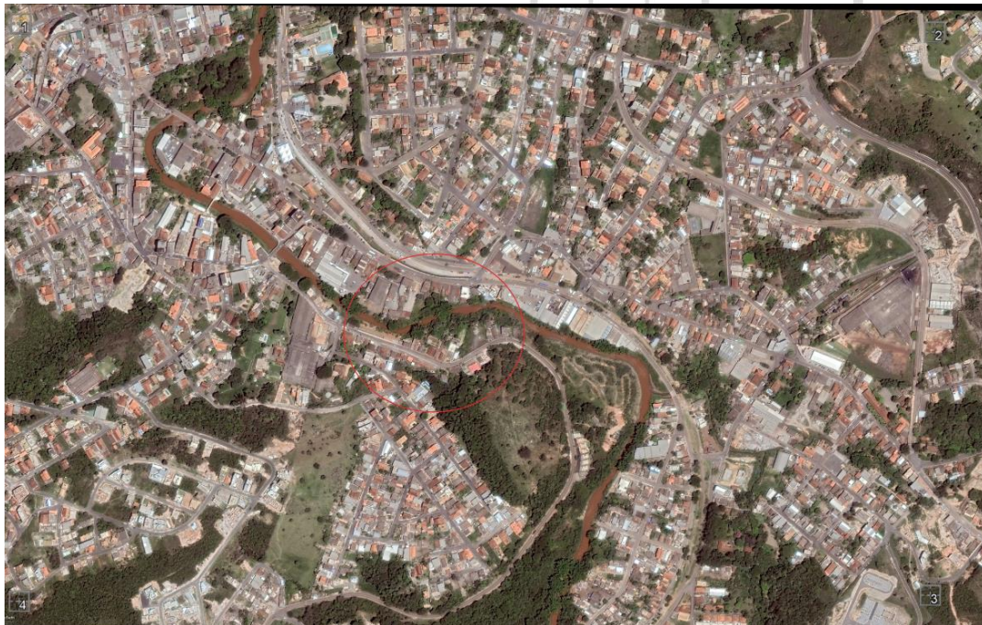
Cidade de Itabirito/MG, ano de 2014.