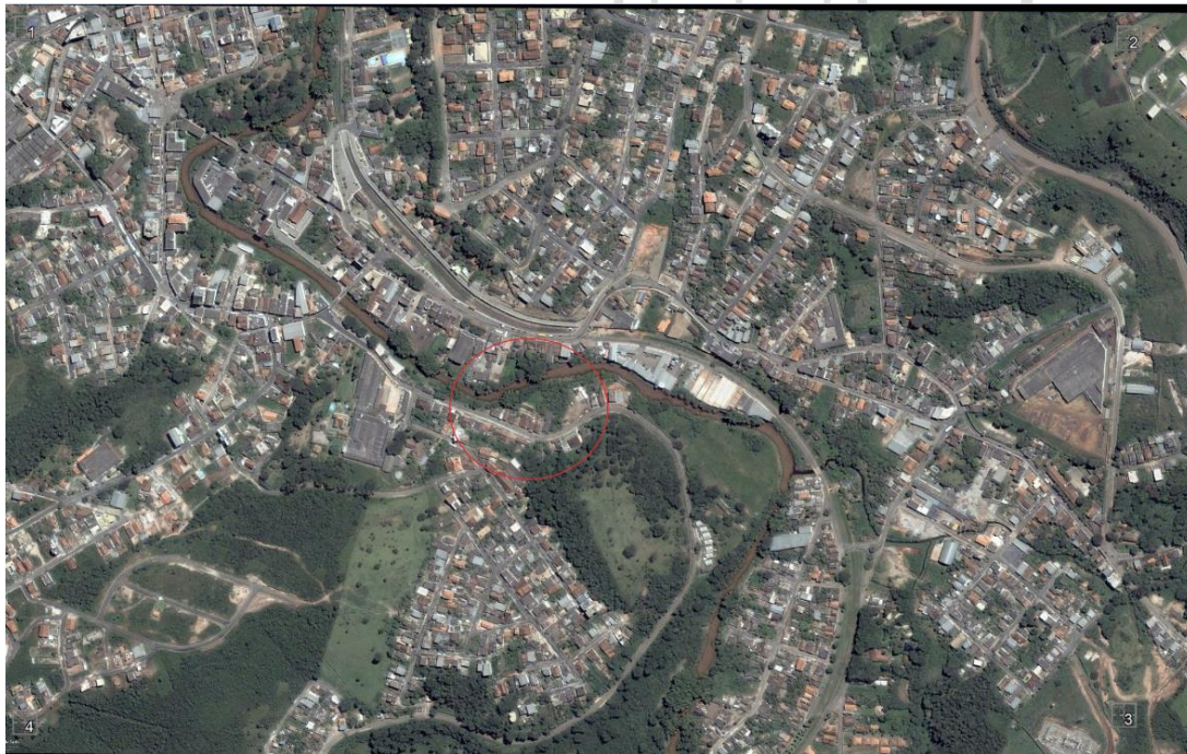
Cidade de Itabirito/MG, ano de 2006.