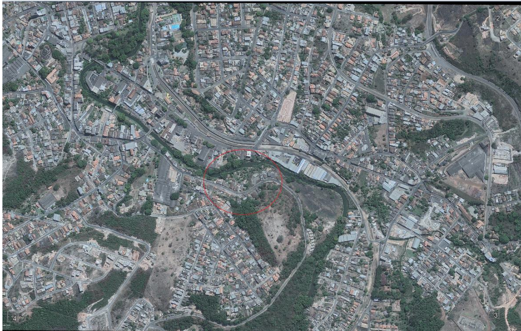
Cidade de Itabirito/MG, ano de 2011.