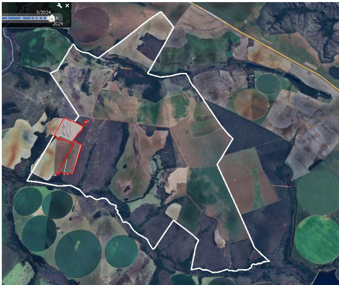
Figura 18: Croqui da área total