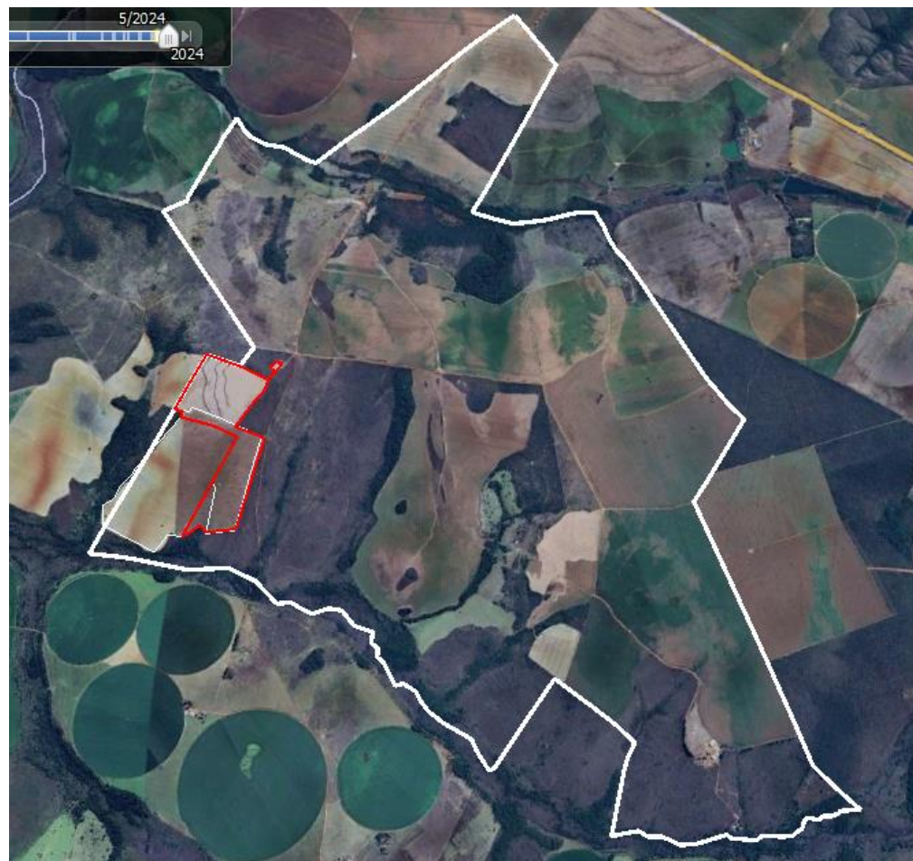
Figura 20: Croqui das parcelas