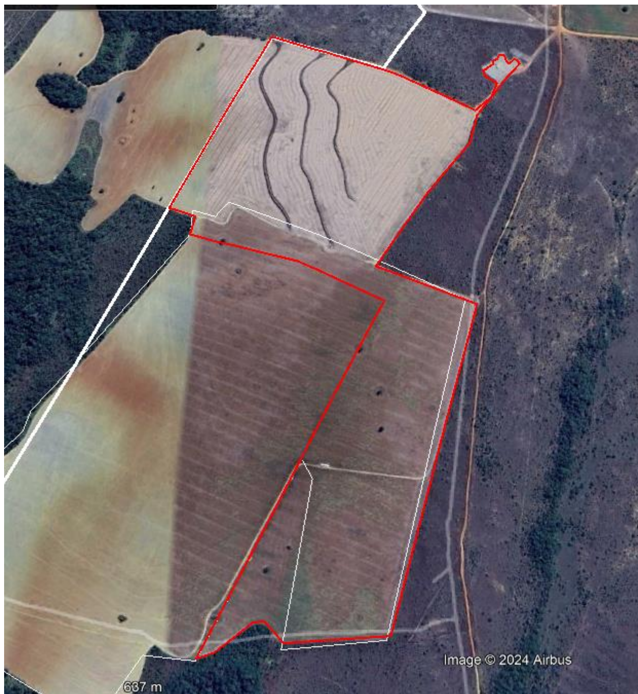
Figura 19: croqui das áreas de da DAIA corretiva