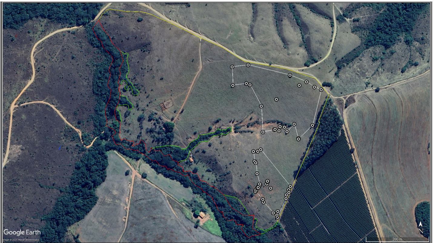
Figura 2. Imagem de satélite do mês de fevereiro de 2003, disponibilizada no Google Earth Pro, com a área que possui fitofisionomia de campo limpo/cerrado e a localização das árvores requeridas.