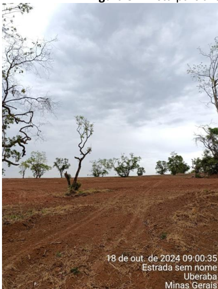
Figura 3 – Vista parcial da área de intervenção ambiental na Fazenda Carolina.