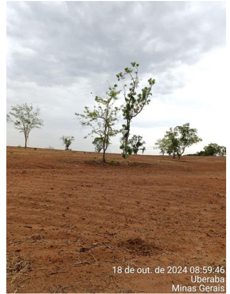
Figura 5 – Vista parcial da área de intervenção ambiental na Fazenda Carolina.