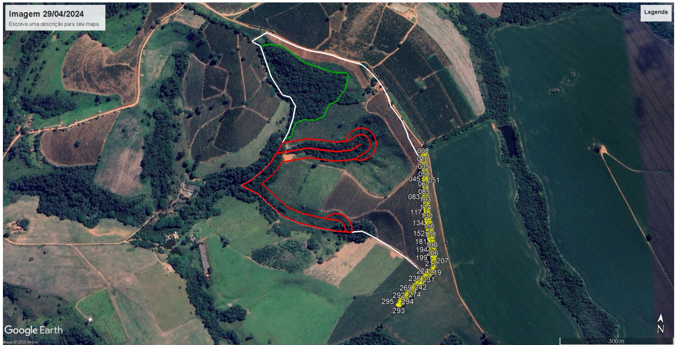
Imagem 02