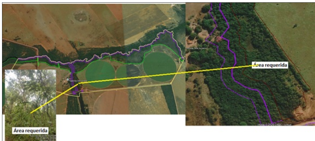
Imagem 03: Imagem de satélite com a delimitação do imóvel, com destaque na área requerida e fotografia tirada in loco do perfil da vegetação.

Em vistoria foi observando a ocorrência de árvores típicas de Cerrado Típico e de Cerradão. Não constatei a presença de espécies imune de corte ou ameaçadas de extinção.