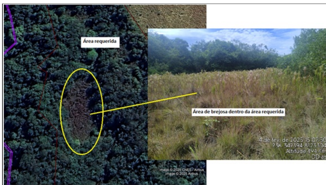
Imagem 04: Imagem de satélite e fotografia tiradas in loco , mostrando a existência de áreas brejosas na área requerida.

Apesar de não declarado pelo requerente, na vistoria presencial realizada na área no imóvel, foi constatado a presença de áreas úmidas e brejosa em meio a área requerida, conforme pode ser confirmada na imagem abaixo.