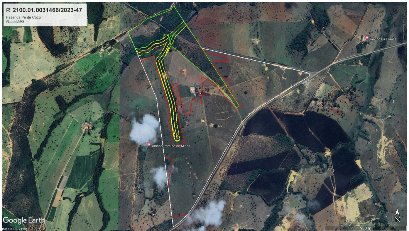
Figura 2: Imagem do Google Earth de 29/09/2023, evidenciando a Fazenda Pé de Coco com base nos arquivos georreferenciados do Cadastro Ambiental Rural da Propriedade (polígono branco). Em evidência, áreas de preservação permanente e reserva legal, conforme declarados no Cadastro Ambiental Rural (polígonos amarelos e verde, respectivamente) e área requerida no processo (polígono vermelho).