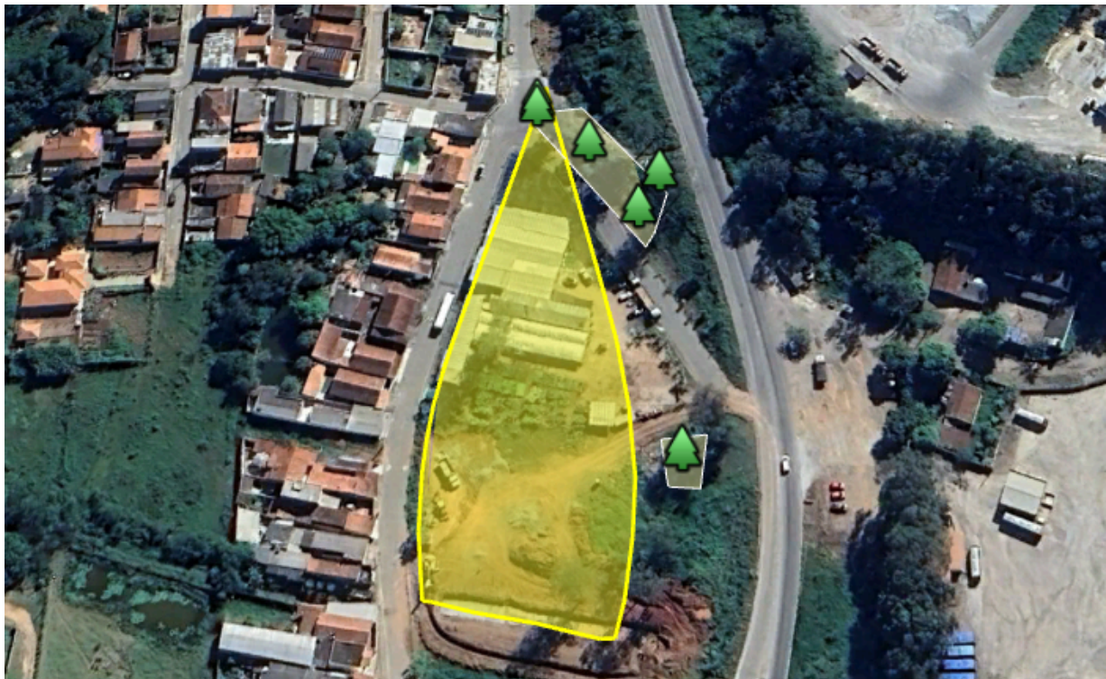
Figura 01: Limites do imóvel apresentado e local das intervenções requeridas.

Em tempo, apesar de não ter sido critério para tomada de decisão o imóvel encontra-se inserido em região urbanizada conforme se verifica pelas imagens de satélite disponíveis, sendo necessário esclarecimento pelo ente municipal se o local é considerado rural em uma eventual análise futura, já que tal fato poderia deslocar competência de análise.