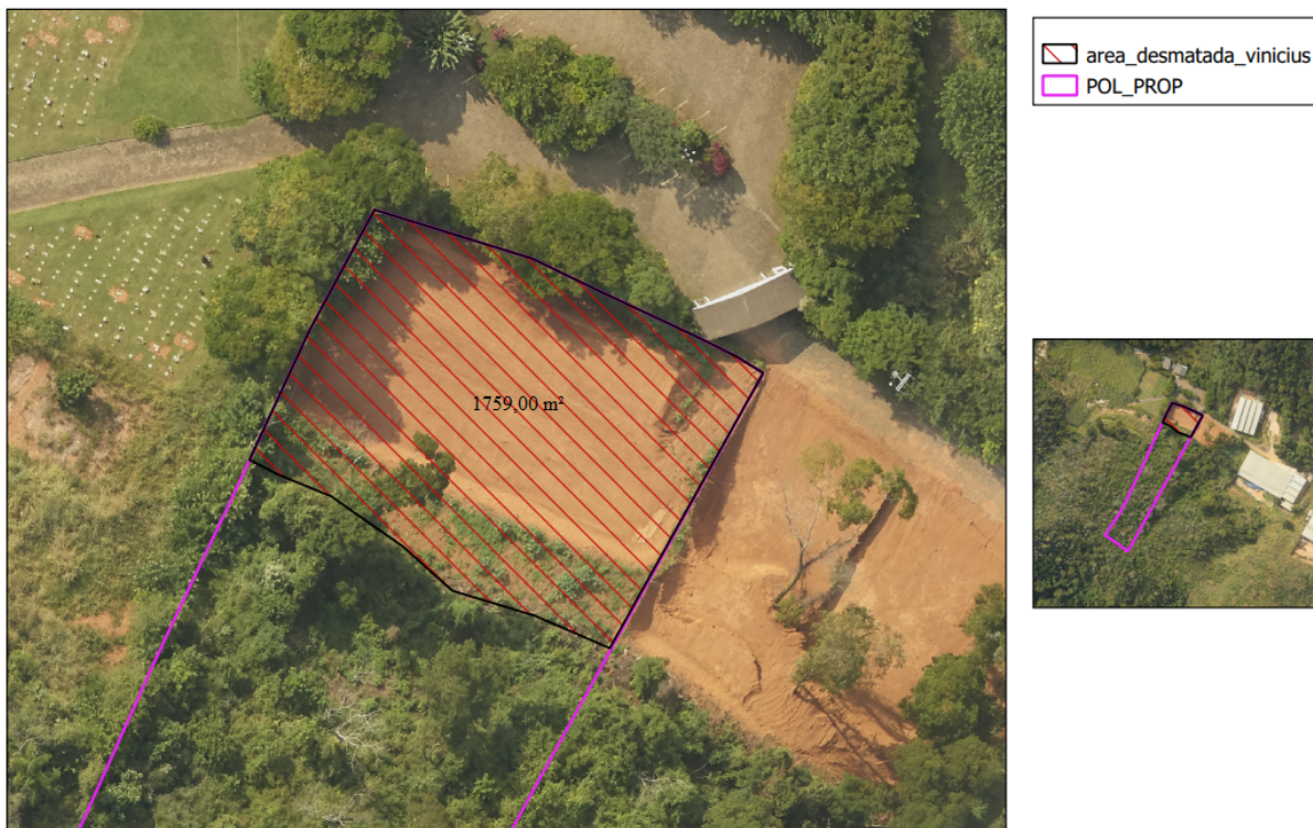
Figura 05: Demonstração de supressão de vegetação nativa realizada superior à área de intervenção informada pelo responsável técnico no requerimento ambiental.

Assim sendo, da forma que foram apresentados os estudos seria necessário a alteração da área de intervenção ambiental que promove alteração de toda a instrução do processo, desde o requerimento ambiental, estudos assim como medidas compensatórias aplicáveis.