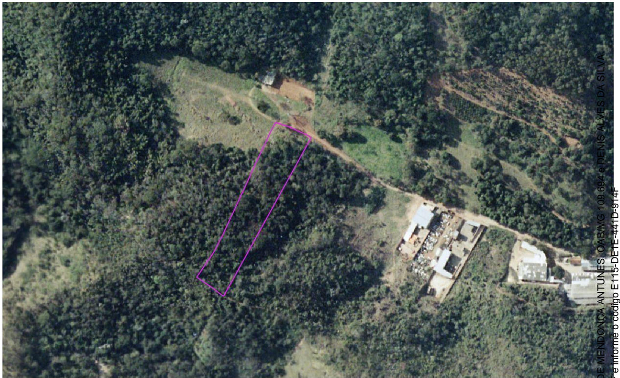
Figura 02 - Aerofotografia de 2005 ortorretificada