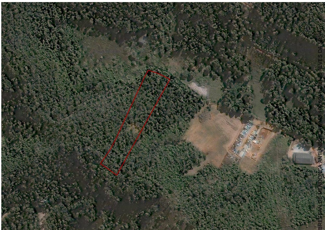
Figura 01 - Imagem de satélite (Quick-Bird) adquirida pela Prefeitura Municipal datada de Junho de 2002 - Em destaque a gleba do presente processo.