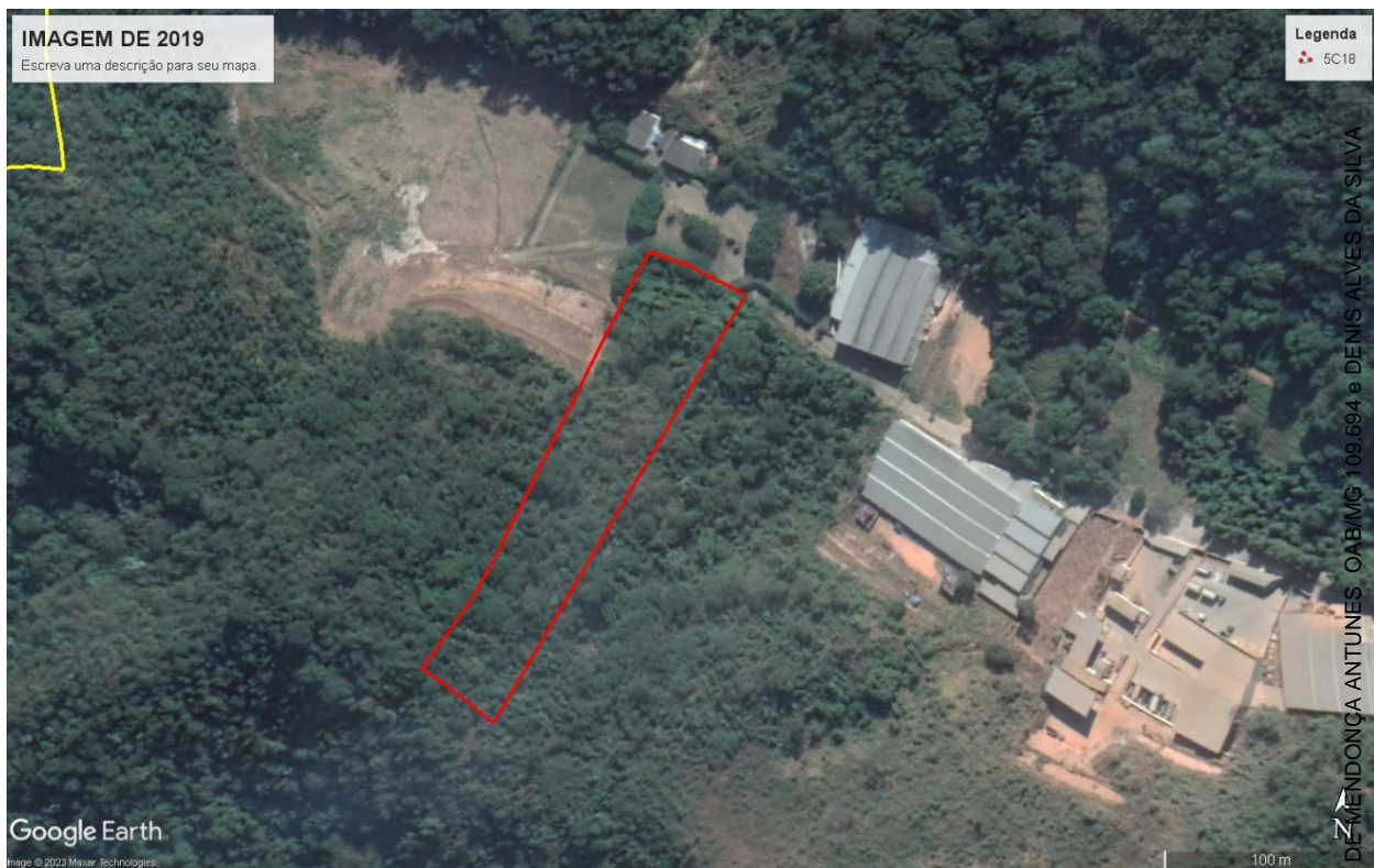
Figura 04: Imagem de Satélite de 2019

- Ao analisarmos o polígono apresentado é possível verificar que a área da gleba delimitada pelo polígono apresentado diverge da área apresentada na planta topográfica e certidão de registro de imóvel, assim como a área que sofreu supressão de vegetação nativa irregular também é superior à informada no requerimento ambiental, conforme Figura 01 :