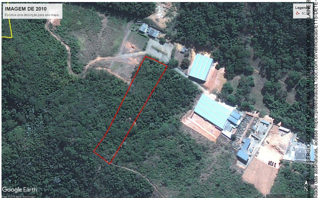
Figura 03: Imagem de satélite do ano de 2010