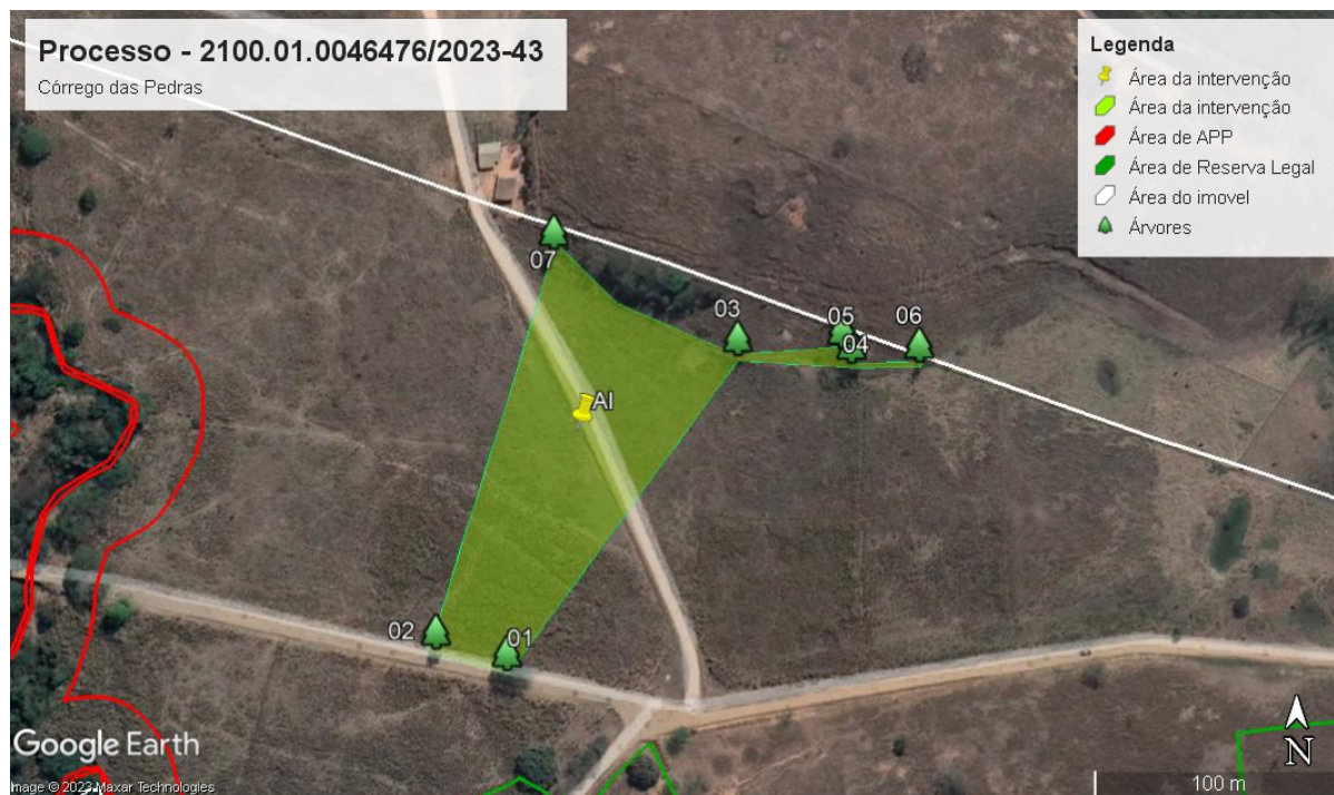
Figura 2: Área da Intervenção ( GOOGLE EARTH, 2022).

Taxa de Expediente: N° 1401303715074, R$ 629,61, pago no dia 01/09/2023