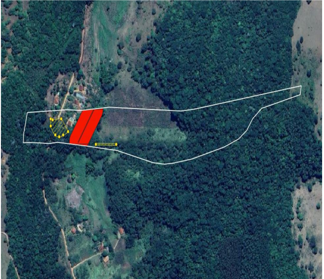
Figura 1. Imagem do Google Satellite mostrando o imóvel (delimitado na cor branca), as árvores requeridas corte (pontos amarelo), a área de intervenção estimada (hachurada na cor amarela) e a área de preservação permanente (cor vermelha) declarada no CAR da propriedade.

A partir da análise de imagens de satélite atualizadas, a equipe técnica do IEF verificou que os indivíduos arbóreos requeridos, NÃO encontram-se isolados, mas sim, localizados em fragmento florestal contínuo com área superior a 0,20 hectare, conforme demonstrado na Figura 1, a seguir.