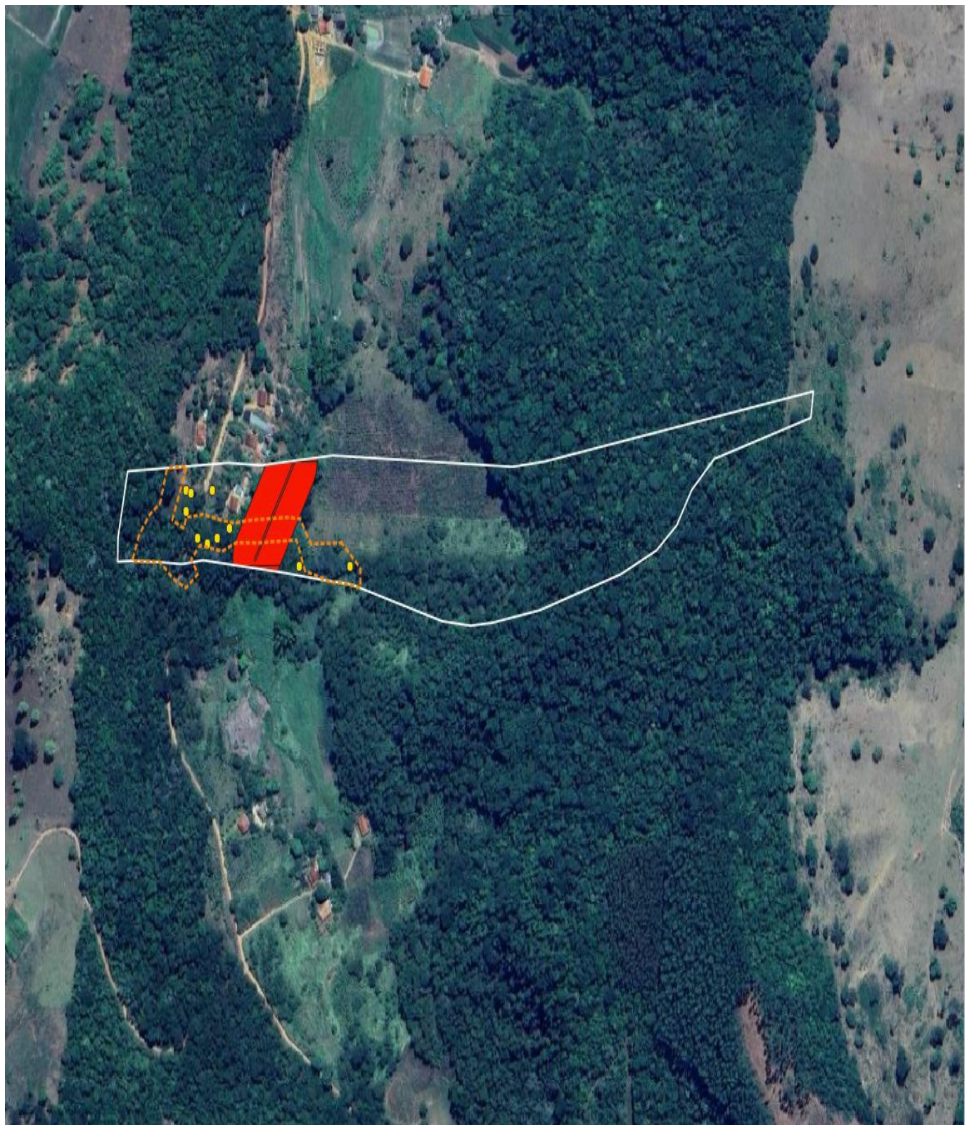
Figura 3. Imagem do Google Satelite mostrando o imóvel (delimitado na cor branca), as árvores requeridas corte (pontos amarelo), as áreas de preservação permanente declarada no CAR da propriedade (cor vermelha) e a área de intervenção ambiental estimada a partir da imagem do satélite Sentinel 2 , obtida em 04/12/2023 (delimitado pela linha tracejada na cor laranja).

Diante dos fatos narrados e da constatação da ocorrência de infrações ambientais na área requerida, sem a devida autorização do órgão competente, serão adotadas as medidas administrativas cabíveis por meio da lavratura de Auto de Infração, com base no Decreto Estadual nº 47.383/2018 com a aplicação das penalidades previstas no referido diploma legal. Recomenda-se desde já a suspensão das atividades na área intervinda irregularmente até a regularização junto ao órgão ambiental competente.